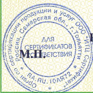
Схема сертификации 1с

ДОПОЛНИТЕЛЬНАЯ ИНФОРМАЦИЯ Место нанесения знака соответствия: в товарно-сопроводительной документации или (и) на маркировочных этикетках или (и) на упаковке.